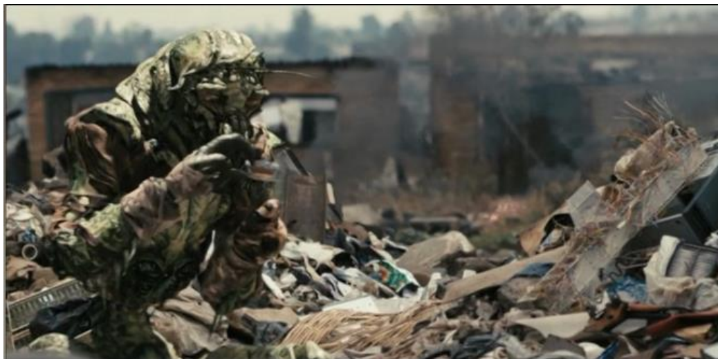
Bilag 8: 1:40:01 - Wikus der sidder og laver metalblomsten til Tania. Dette er det sidste, som man ser til Wikus.