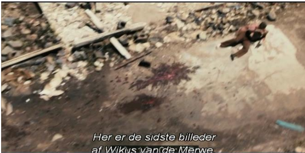
Bilag 6: 1:37:56 - dokumentarfilmen påstår, at dette er de sidste forekommende billeder af Wikus.