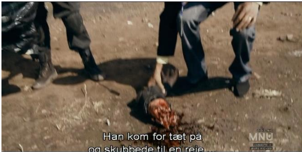
Bilag 4: 0:13:13 - afreven arm fra en soldat. Umiddelbart synes denne eksplicitte vold uegnet i en dokumentar.