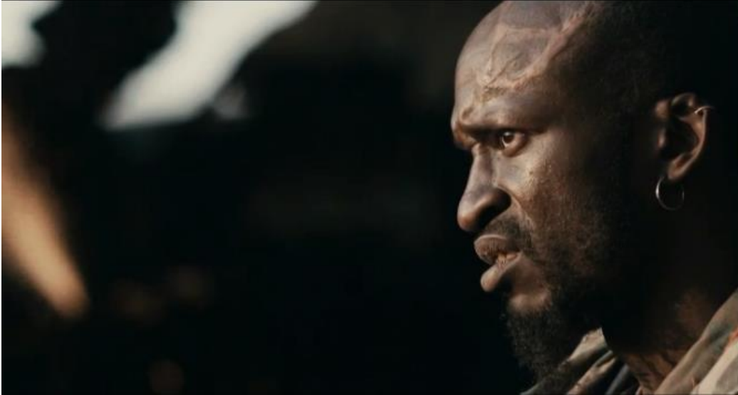
Bilag 5: 0:15:24 - Obesandjo filmes fra siden mens han kigger ud på Wikus og holdet. Denne kameravinkel er et tydeligt eksempel på fiktionisering. Billedets æstetiske fremtoning forekommer ligeledes afvigende i forhold til den dokumentaristiske.