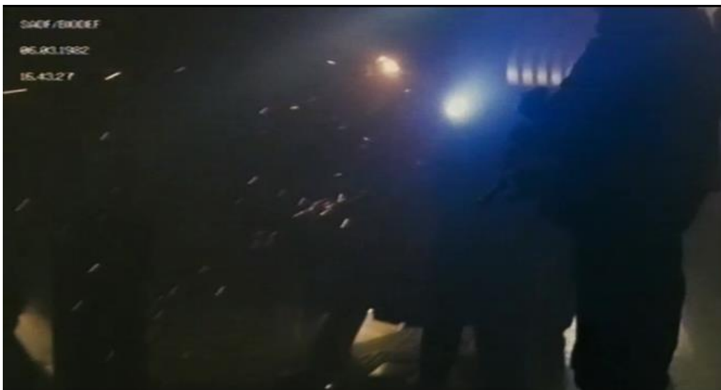
Bilag 2: 0:01:35 - Et eksempel på found footage.