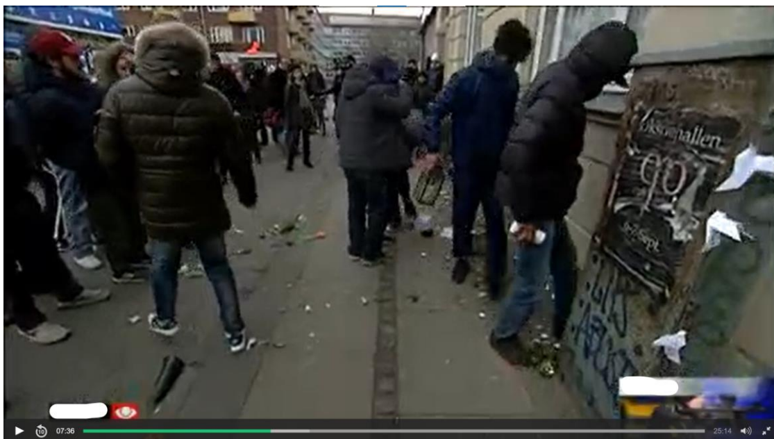
Billede 5 (ibid.) De maskerede mænd, der er i gang med at fjerne vejkmindemærket

Sumiala kaldte denne type ritualer for 'civic rituals', hvilket antyder, at disse vejkmindemærker er en selvorganiseret og symbolsk handling, der bidrager til at give udtryk for en følelse af fællesskabet efter terrorangrebet. I TV-avisen blev det nævnt, at der blev lagt et vejkmindemærke ved stedet, hvor gerningsmanden, Omar Abdel Hamid El-Hussein, blev skudt af politiet. Det blev dog understreget, at mindesmærket blev fjernet af maskerede mænd, der mente, at vejkmindemærker ikke er en del af muslimsk praksis (DR1 2015, 7:32-7:36).