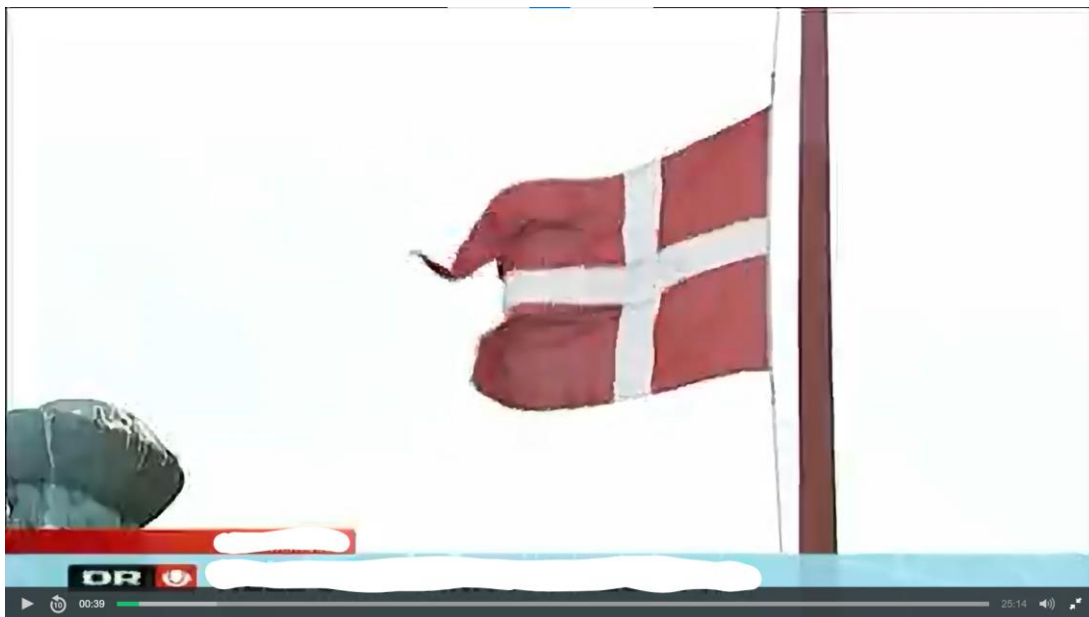
Billede 1 (DR1 2015)