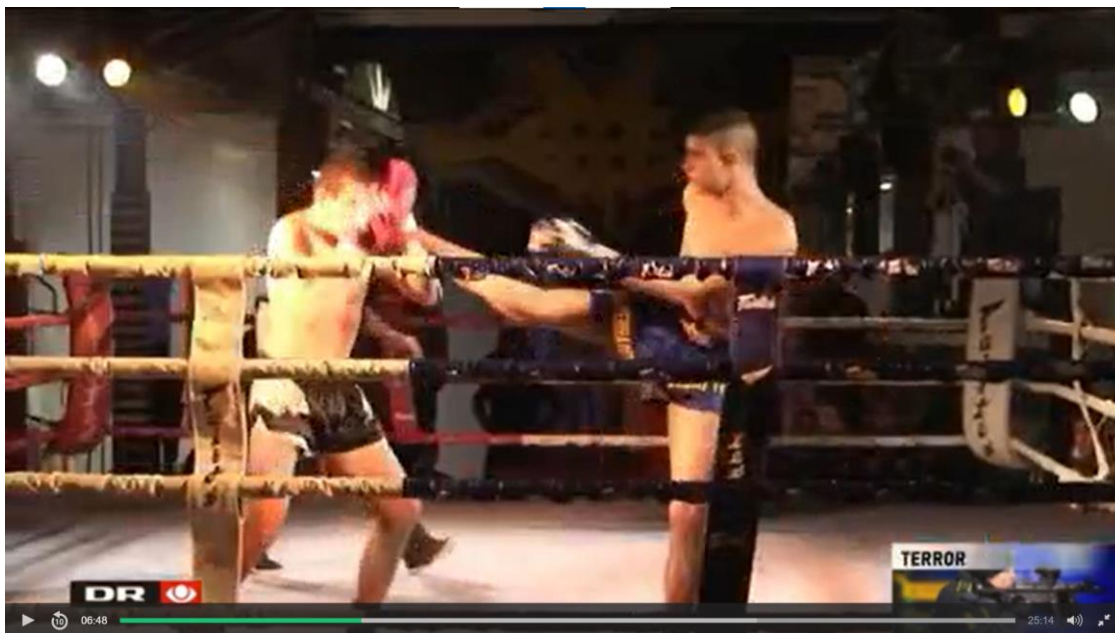
Billede 6 (DR1): fra en video af Omar El-Hussein (i de blå shorts) til en kick-boksningskamp.