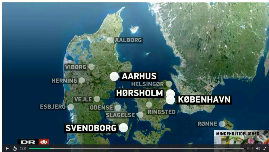
Billede 2 (ibid.)

Efterfølgende viste TV-avisen et kort over alle de steder i Danmark, hvor der blev holdt mindehøjtideligheder. Jeg ser dette som endnu et eksempel på et nationalt sørgeritual, da disse billeder bidrager til at fremhæve det nationale fællesskab.