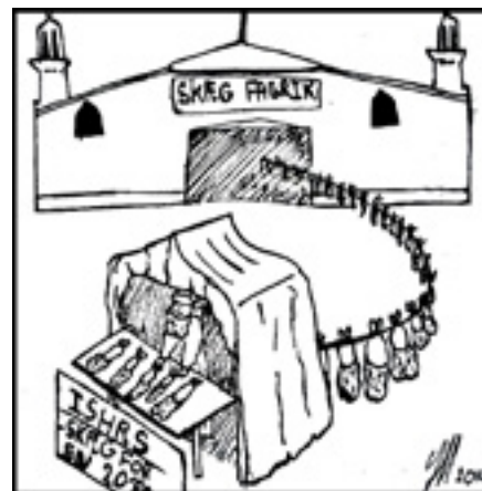
ILLUSTRATION | JONAS UHD

er religiøst eller kulturelt motiveret, fremgår imidlertid ikke af rapporten. Da størstedelen af indbyggerne i de mellemøstlige lande er muslimer, er det nærliggende at forestille sig, at der er tale om en religiøst funderet tendens. Som eksempel herpå kan man læse i en af haditherne, der beretter om Muhammeds sædvaner, findes en opfordring til at muslimske mænd bør trimme deres overskæg, men lade resten af sit skæg gro.