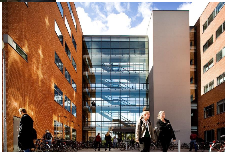
Figur 1