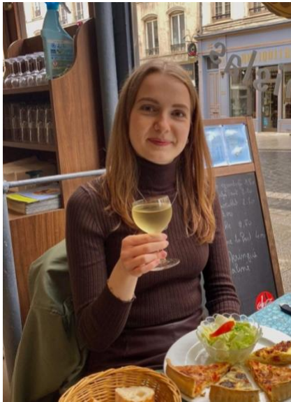
Fransk yndlingsret: Beignet