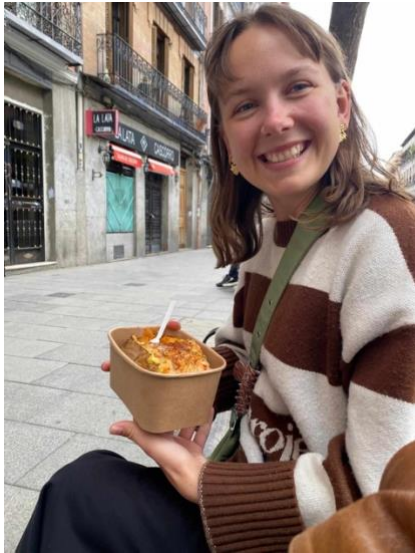
Fransk yndlingsret: Œufs en Meurette