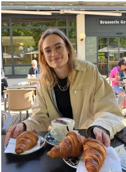
Fransk yndlingsret: Escargots