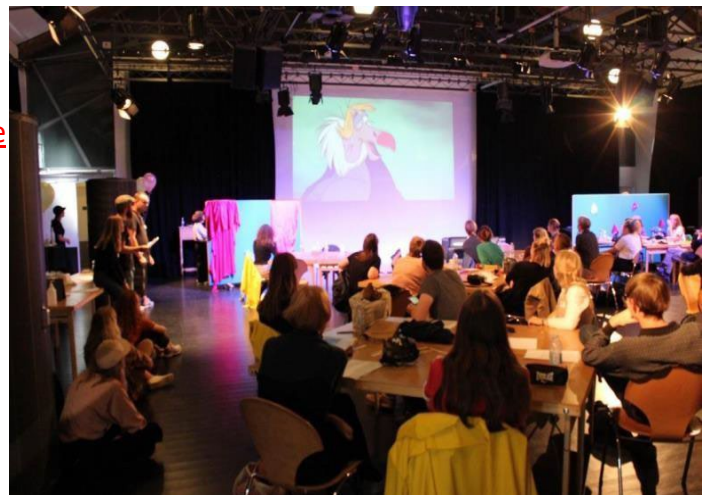
Introuge 2021 – studiestartsproduktion.

Tilmeld dig også her: Tilmelding til aftenarrangementer studiestart 2026