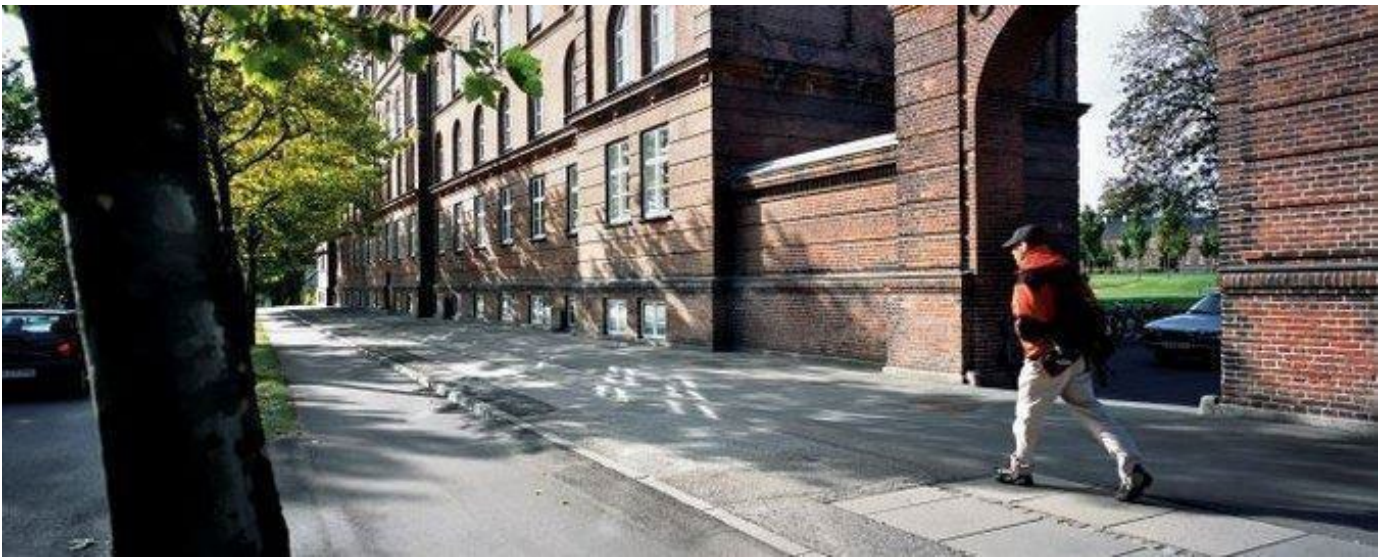
Kasernen set fra Langelandsgade.

Kontakt da endelig os, så vil vi gøre vores bedste for at hjælpe med at finde en seng i den uge.