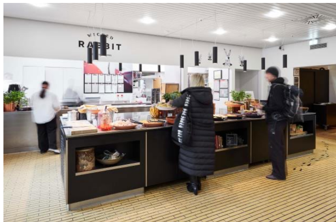
Kantinen på Det Kongelige Bibliotek – Victor Albecks Vej.

Der er ikke en kantine på Kasernen, men der er mulighed for at købe mad i Matematisk kantine og kantine på Det Kongelige Bibliotek (Vi viser rundt mandag eftermiddag).