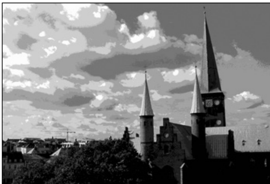
Programmet for Teologiens Døgn har noget for enhver smag - fra gudstjeneste til pubquiz. Arrangementet finder sted d. 5.-6. april.