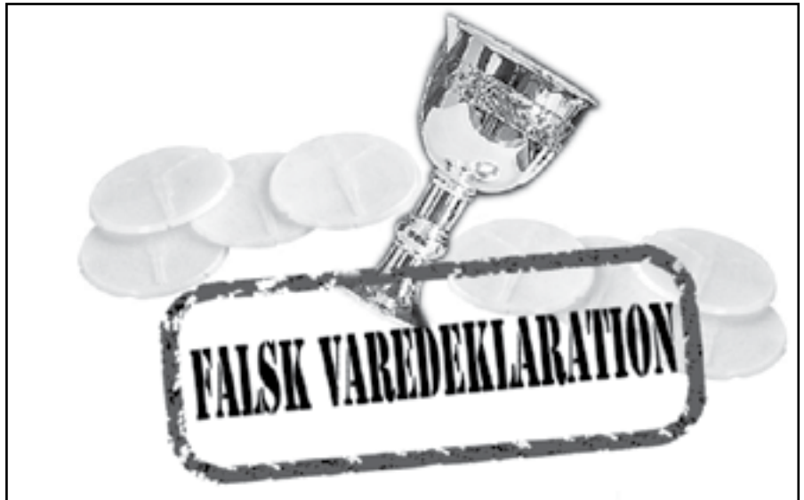
GRAFIK | SOPHIE LØNNE HUNDEBØLL

I en tid præget af mistillid og falske varedeklarerationer syntes det efterhånden kun at være kirken, som kaldte tingene ved rette navn. Imidlertid er dette sidste tilflugtssted nu også forsvundet. Fødevaremyndighederne har, efter at have undersøgt oblater og altervin, kunnet afsløre, at nadveren slet ikke er Jesu Kristi legeme. En talsmand for myndighederne udtaler til FigenBladet : »Oblaterne indeholdt hverken menneskekød eller nogen anden form for kød. Faktisk består de ikke af andet end hvedemel.« Formanden for Landsforeningen af Menighedsråd er forarget: »Dette er blot endnu et eksempel på præsternes manglende integritet. I årtusinder er vi åbenbart blevet spist af med kiks og portvin.« Spørgsmålet er nu, hvorledes teologerne vil forklare fænomenet. Dekanen for F.arts ser på sagen med