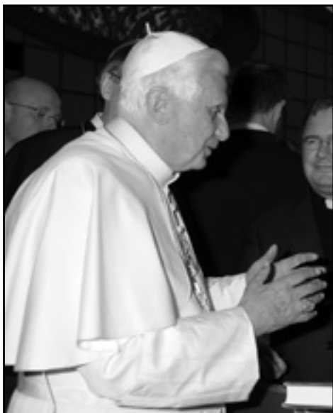
Efter knap syv år i embedet trådte Hans Hellighed Pave Benedikt XVI tilbage som den første pave i 700 år.