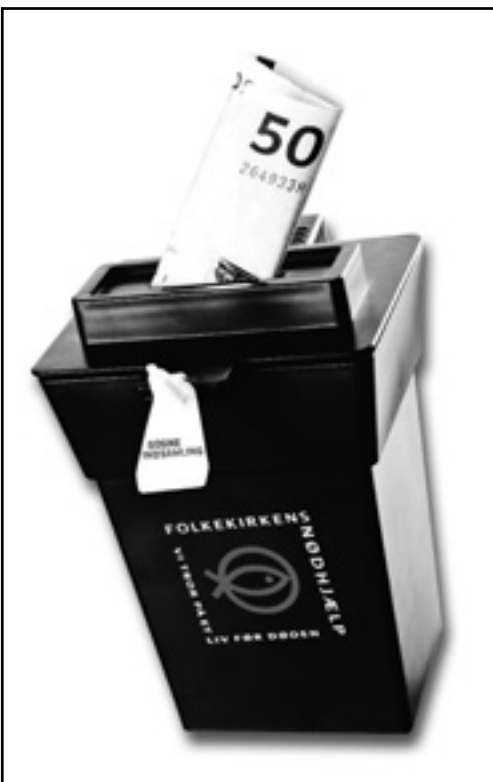
På hjemmesiden for danske hjælpeorganisationer beskrives Folkekirkens Nødhjælp som 'en nødhjælpsorganisation udsprunget fra et kristent miljø og med kristne visioner som næstekærlighed og mottoet "et liv før døden"'