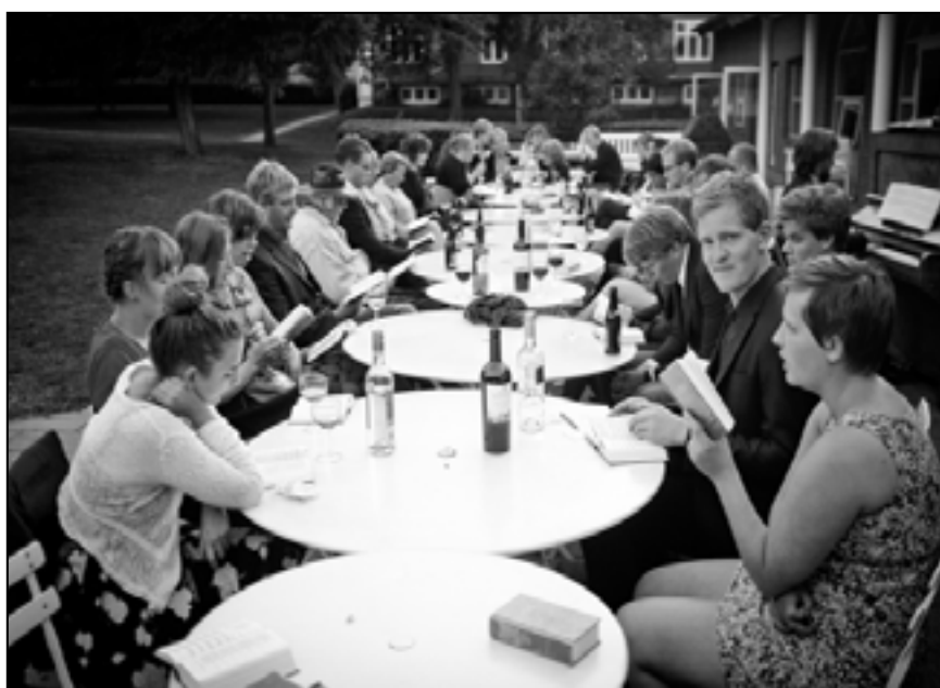
En af de faste traditioner til Studenterkredsens Sommermøde er onsdagens sommerbal med lanciers og højskolesang, gerne med sange fra før 1900.