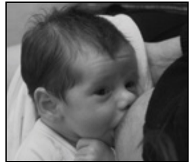
Hvorfor kan vi føle os krænket, når vi møder den ikke-seksuelle nøgenhed?