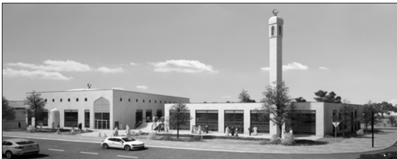
GRAFIK | WWW.JOHANNSEN-ARKITEKTER.DK

at universitetets formidlingsforpligtelse indbefatter, at man stiller op til hvad som helst. Formidlingsforpligtelsen handler i mine øjne ikke primært om formidling i medierne. Folkeuniversitetet og alverdens foreningsforeninger er også vigtige steder for forskningsformidling, som også artikler i peer-reviewed såvel som ikke peer-reviewed tidsskrifter er det. Og at forskning kan formidles på god vis på nettet er henvisningen til data publiceret af Center for Samtidsreligion i 2012 Report on International Religious Freedom et godt eksempel på. Rapporten udgives af det amerikanske udenrigsministerium og er styrende for den officielle amerikanske forståelse af religionsfrihed over hele verden. Angående moskéen i Røvsingsgade så er Facebooksiden 'Ja til moskéer i Danmark' flydt over med glade tilkendegivelser fra muslimer og ikke-muslimer. Lur mig om ikke moskéen vil komme til at danne baggrund for mange nyhedsindslag. Tiden må vel vise, hvor mange af de københavnske muslimer, der tager imod invitationen til at bede i de 'nordisk-minimalistiske' rammer.